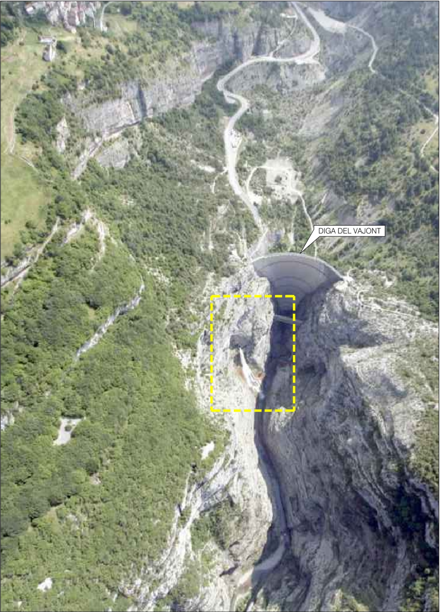
FOTO AEREA DELL'AREA DI POSIZIONAMENTO DELL' IMPIANTO